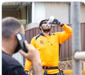
עובד בשטח במהלך הפסקת מים באזור עבודה פעיל