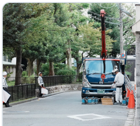
עבודות לצד משאית שירות עם הפרדת תנועה חלקית בלבד