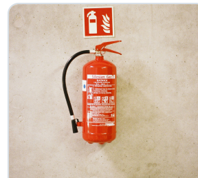
עמדת כיבוי המחייבת סימון נגיש ובקרה תקופתית