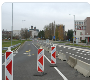
חסימת נתיב מעבר ותיחום זמני באזור תנועה פתוח