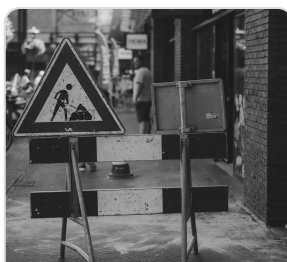
שילוט אזהרה וגידור זמני באזור מעבר פעיל